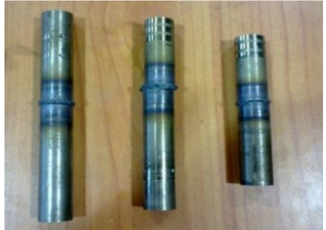
Hình 4. Mẫu mối hàn sau khi hàn thực nghiệm