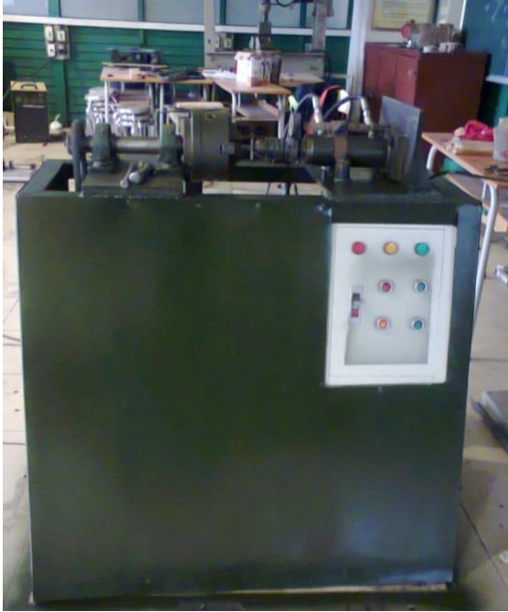
Hình 2. Máy hàn ma sát quay

Sử dụng máy thử độ dai và đập JBW- 300B (hình 3) tại phòng thí nghiệm vật liệu 103 A5 trường Đại học SPKT Nam Định để làm thí nghiệm thử và đập mẫu mối hàn.