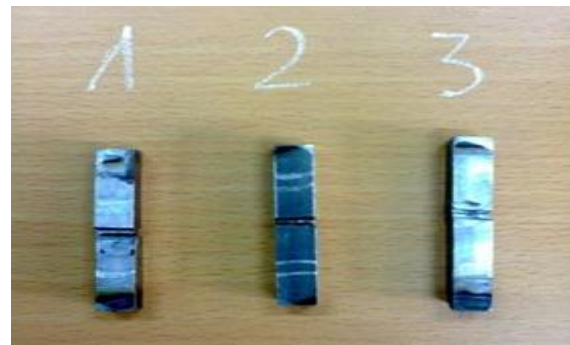
Hình 5. Mẫu thử nghiệm độ dai và đập

Mẫu thử nghiệm được gia công theo đúng kích thước tiêu chuẩn (dài x rộng x cao): 50 x 10 x 10 (hình 5).