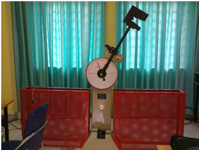
Hình 3. Máy thử độ dai và đập JBW- 300B

Vật liệu: Phôi thép CT38; đường kính phôi 16mm.