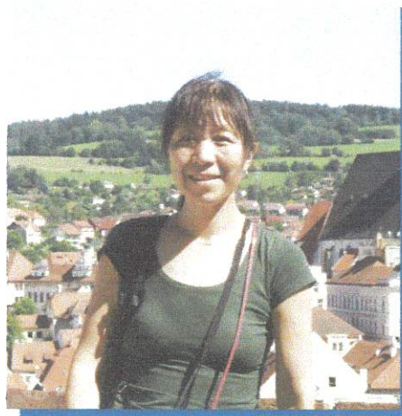
Phó Giáo sư, Tiến sĩ Noriko Iwashita

Bà là Phó Giáo sư Ngôn ngữ học ứng dụng và Giảng dạy tiếng Anh cho người nói ngôn ngữ khác (TESOL); chuyên gia của các dự án như Đánh giá năng lực ngôn ngữ, Giáo dục song ngữ và ngoại ngữ (tiếng Anh, tiếng Nhật, tiếng Trung và tiếng In-đô-nê-xi-a). Bà cùng các nghiên cứu viên tại Trung tâm Nghiên cứu Kiểm tra Đánh giá Ngôn ngữ, Đại học Melbourne phát triển bài kiểm tra nói TOEFL (Bài kiểm tra tiếng Anh như một ngoại ngữ của Viện Khảo thí Giáo dục, Hoa Kỳ). Bà đã có nhiều năm giảng dạy tiếng Nhật ở nhiều cấp độ khác nhau ở Melbourne, đồng thời giảng dạy các khóa học Ngôn ngữ học ứng dụng và hướng dẫn các dự án nghiên cứu của sinh viên đại học và sau đại học tại Đại học Melbourne và các trường đại học ở Hoa Kỳ.